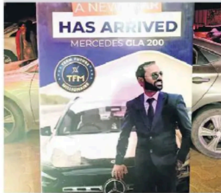
22 सितंबर को सेमिनार के बाहर मर्सिडीज के होर्डिंग लगाए।

एक निवेशक ने बताया कि संचालकों ने लोगों को झांसे में लेने के लिए जोधपुर के महंगे होटलों में सेमिनार किए। इसमें बड़ा मुनाफा दिए जाने का दावा किया जाता रहा। निवेशकों का भरोसा जीतने के लिए उन्हें मौके पर ही मर्सिडीज, रेंज रोवर और बीएमडब्ल्यू जैसी महंगी गाड़ियां भी बांटी गईं। शहर के दो शोरूमों पर अब भी चार-पांच गाड़ियों की बुकिंग की हुई है। कई निवेशकों को गोवा, थाईलैंड, दुबई, सिंगापुर और मलेशिया सहित अन्य देशों के दूर पर भी भेजा गया।