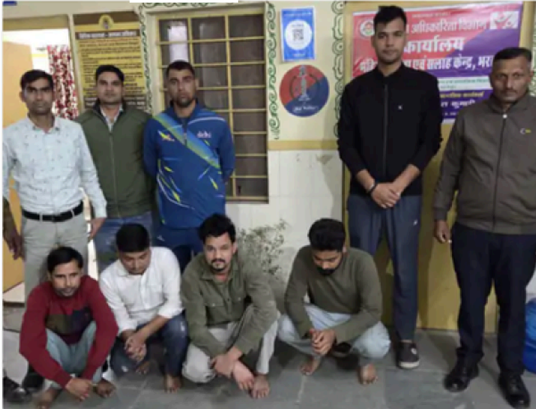
XPO वेबसाइट के जरिए आरोपी करते थे लोगों से ठगी।

भरतपुर पुलिस ने XPO वेबसाइट के जरिए ठगी करने वाली गैंग के 4 सदस्यों को गिरफ्तार किया है। आरोपी ज्यादा ब्याज का लालच देकर लोगों से ठगी कर रहे थे। इस गैंग में कई सदस्य हैं। पुलिस बाकी आरोपियों की गिरफ्तारी के प्रयास कर रही है।