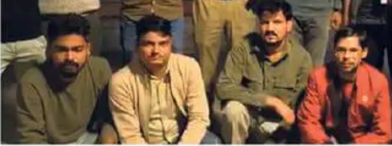
भरतपुर पुलिस ने 4 माह पहले इस ठगी में इन आरोपियों को किया था गिरफ्तार।

ऐसे हुआ खुलासा : देशभर के थानों में मुकदमे दर्ज हुए। पीड़ित के अनुसार प्रदेश में 12 नवंबर 2025 को भरतपुर के मथुरागेट थाने में पहला मामला दर्ज होने की जानकारी सामने आई। इसमें पुलिस ने आरोपियों से नकदी, सोना, यूएसडीटी तथा लज्जरी वाहन बरामद किए गए। फिर भरतपुर कोतवाली में पांच मुकदमे, थाना अटलबंद में दो मामले, हलेना, बयाना, विद्याधरनगर में एक-एक मुकदमा दर्ज है। इसके अलावा आरोपियों के खिलाफ देशभर में 500 से अधिक मामले दर्ज होने की प्रारंभिक जानकारी सामने आई है।